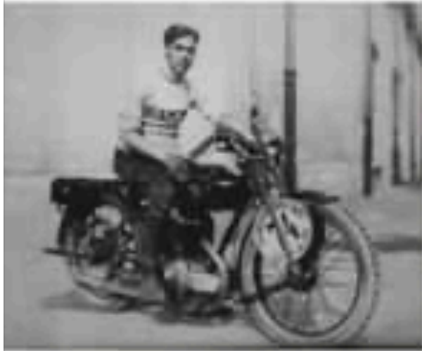
Il grande pilota Tazio Nuvolari a bordo di una motocicletta mentre indossa la maglia Bianchi The great pilot Tazio Nuvolari on a motorcycle wearing the Bianchi jersey

Nell'immaginario collettivo, Nuvolari viene dipinto a bordo di auto da corsa perhaps di marca Alfa Romeo e di colori rossi. La foto più famosa lo ritraggono nella polverosa strada della Mille Miglia 1931, appena tornato ad affannarsi un momento sul circuito cittadino di Monto Carlo con la testa piagnucolosa verso l'orizzonte della curva. Nel 2022 ci sono stati grossi festeggiamenti per celebrare i 100 anni dalla nascita del campione, con diverse manifestazioni, raduni di auto d'epoca a tema e produzione di oggetti a tema, così come si era avvenuto nel corso del 2021 per il 70° anniversario della sua morte.