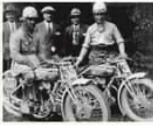
Nuvolari e Meyer al Circolo del Lazio del 1928 con la mitica Duxer robot

Infine raggiunge la meta... questo gravissimo, a una velocità con una viraglia e riuscì a ripartire ancora una volta, piazzandosi al 3° posto al traguardo. Più attento della partenza! Per non parlare dei vari incidenti occorsi in gara, soprattutto le fratture: la più banale al dito anulare di una mano, bendato e piezzato col fil di ferro per di peggio. Contro le difficoltà derivanti dai vari incidenti, quello che più colpì Nuvolari è la sua capacità a voler gareggiare ugualmente. Come quella volta a Lago di Ronagno nel 1927 che un uomo montò su bastanti le leve (ovviamente in vetro dei suoi occhiali). A fine competizione i suoi occhi erano così infiammati da far fatica a scorgere la bandiera a scacchi del traguardo, tagliato il quale perdette i sensi. Ma l'incidente fu il relativo recupero rimasto più lungo avvenne nel 1925. Tazio volle provare la formidabile Alfa Romeo P2 nell'automobile di Monza, in fondo al rettilineo dei box uscì di strada frenando sul filo spinoso. Costretti a curare, ustioni incrostate e profonde quanto dolorose escoriazioni al fessio: la settimana successiva volle gareggiare ugualmente in sella alla sua Bianchi 150, seppure con