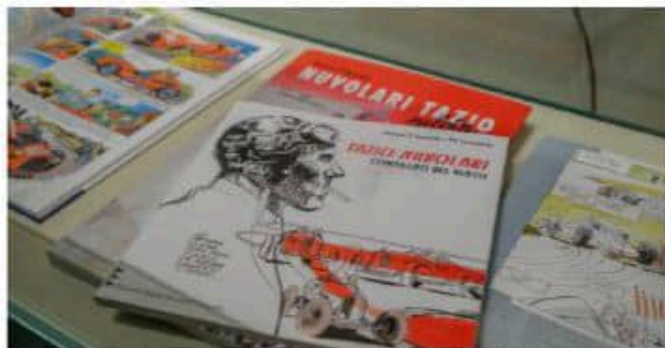
I fumetti Gli originali provengono da collezioni private e dal museo Wow di Milano