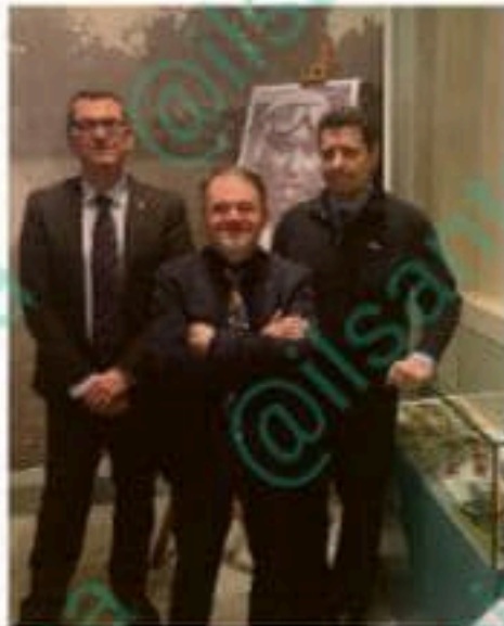
Lo spazio è stato inaugurato ieri al Museo

Inaugurata la nuova sezione del museo che cambierà volto 3 volte nel 2025 per esperienze in continua evoluzione